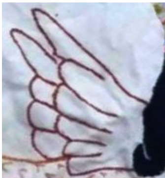
شکل ۵: بال‌های شاماران، بخشی از تصویر ۳

در شکل شماره پنج، بال‌های بسته، ارتباط موجودات الهی و مافوق طبیعی را با اسطوره شاماران نشان می‌دهد. بر اساس تحقیق احمد اقتداری ۱ ، کبوتر از نشانه‌های زهره (آناهیتا) است (همان‌جا).