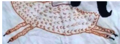
شکل ۴: بدن و پاهای شاماران، بخشی از تصویر ۳

اثر، به جای سُم چهارپایان، سر مار را بر انتهای دست و پا نقش کرده است. دست‌ها و پاها کاملاً باز و در جهت مخالف همدیگر تصویر شده‌اند که سبب القای حرکت یورتمه شاماران در ذهن بیننده می‌شود. مارها به گونه‌ای که آماده دفاع از جان خود هستند، نیششان را بیرون آورده‌اند. بافت بدن در این قسمت با دوخت متفاوتی جدا شده است. این در حالی است که در بیشتر موارد شاماران با تعداد بیشتری از دست و پا نشان داده می‌شود که حالت سکون یا حرکت آهسته را نشان می‌دهند؛ اما در فرم دست و پاها که به شکل مار ترسیم می‌شوند مشترک هستند. در قسمت بدن در هیچ‌کدام از تصاویر مشاهده شده به حالت نر و مادگی شاماران اشاره نشده است و تنها از روی سر آن جنسیت تشخیص داده می‌شود و بافت تصویر شده برای بدن، دست و پا مشابه است.