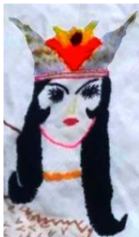
شکل ۶: سر شاماران، بخشی از تصویر ۳

ایجاد کرده است. در بالای تاج شاماران، دایره‌ای کوچک و قرمز رنگ وجود دارد که می‌تواند نقش سنگی قیمتی باشد.