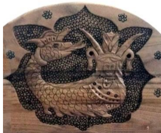
شکل ۲: کنده کاری نقش شاماران روی تختخواب (شهرستان مهاباد، متعلق به سال ۱۳۹۳)

این داستان روایتی کلی است از ماجرای این حیوان ترکیبی و اسطوره ای که در روستاهای مختلف و برخی مناطق شهری منطقه مکریان به مرکزیت مهاباد از پدران و مادران برای فرزندان نقل می شود و در مناطق مختلف با برخی جزئیات متفاوت بیان تصویر می شود؛ ولی کلیت ماجرا و شکل آن ثابت است (شکل شماره ۲).