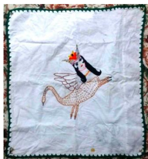
شکل ۳: دستمال تزئینی شاماران