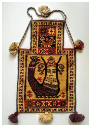
شکل ۱۰: کیسه تزئینی نگه‌داری نمک با نقش شاماران (عکس: نگارندگان، شهرستان مهاباد، متعلق به سال ۱۳۹۰)

در هنر بین‌النهرین معمولاً اژدر و اژدر - مار به‌عنوان محافظ دروازه‌ها، چشمه‌های آب حیات و بی‌مرگی و قداست و نیز همه‌نشانه‌ها و علائم مربوط به زندگی، باروری، قهرمانی، بیماری و گنجینه‌ها به‌شمار می‌روند (الیاده، ۱۳۷۲).