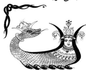
شکل ۱: اسطوره شاماران (Barzan, 1993: 38)

شاماران را سه قسمت کنند. وزیر دمش را می خورد و سر شاماران را به خورد تامه سپ می دهد و دستور می دهد بدن شاماران را برای پادشاه کباب کنند. وزیر حریص درجا می میرد؛ زیرا شاماران واقعیت را نگفته بود. پادشاه سلامتی اش را باز می یابد و تامه سپ به تمام رازهای نهانی جهان آگاه می شود. تامه سپ، لقمان حکیم می شود، کسی که تمام گیاهان، رازهای پزشکی شان را به او می گویند.