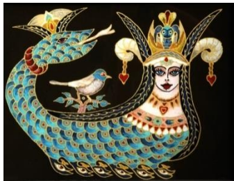
شکل ۸: تابلوی دیواری شاماران (عکس: نگارندگان، روستای لج، مکریان مهاباد)

تاریخ پیدایش شاماران به روشنی مشخص نیست؛ اما در تمامی روایت‌ها هدف از کشته شدن شاماران، بهبودی، شفا و یافتن آگاهی انسان است. این افسانه در بین اقوام گُرد، درمانگر بودن شاماران و آگاهی او به رازهای جهان را بیان می‌کند. در نقوش و بافته‌های مردم این منطقه، شاماران اسطوره‌ای ترکیبی بین زن و مار است. مردم این روستا معتقدند شاماران روزی آن‌ها را فزونی می‌بخشد. به همین دلیل خانه‌هایی را برای زندگی انتخاب می‌کنند که در اطرافشان مارها دیده شده باشند. گاهی مردم، بال پرندگان را هم برای شاماران متصور می‌شدند (شکل شماره ۸).