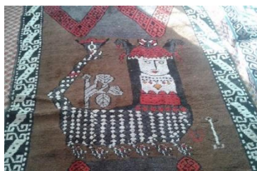
شکل ۹: گلیم و قالی دارای نقش شاماران (روستای دریاس، متعلق به سال

مارهایی با سر انسان، گواهی بر جنبه الوهیت این خزنده به‌دست می‌دهند (هینتس، ۱۳۷۱). به‌نظر می‌رسد این پرستش خدایان، به‌مرور زمان منسوخ شده و چهره‌ای مرموز داشته است. گاهی نمادی از نیروهای سودبخش بوده است و حاصلخیزی و برکت را به همراه می‌آورده و گاهی نیز نشانه‌ای از نیروی هولناک بوده است که ویران‌کننده و مصیبت‌آور است. وجود این نقش‌مایه در زیر پی‌بناها دلالت بر آن دارد که برای دفع چشم‌زخم و دوری از نیروهای شوم موجود در قلمرو عالم زیرین به‌کار می‌رفته است.