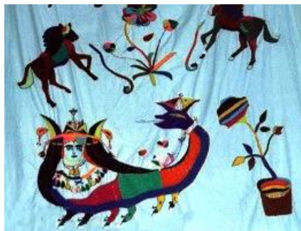
شکل ۱۱: پرده منقوش با تصویر شاماران (عکس: نگارندگان، روستای لچ، متعلق به سال ۱۳۶۰)

نقش مار در کردستان، بیش از هر چیز دربردارنده مفاهیمی چون نیروهای جهان زیرین، نامیرایی و باروری است و بیش از هر فرهنگ و تمدن دیگری با آیین‌های منطقه خود مرتبط است. هم با نوعی تقدس و احترام همراه است هم با وحشت. رابطه انسان و مار در هیبت شاماران شکل جدیدی به‌خود می‌گیرد که اتفاقاً همچون گذشته خطرناک نیست و از دوستان انسان به‌شمار می‌آید. شاماران نماد دوستی، محافظت پیمان و خوش‌یمنی است (شکل شماره ۱۰).