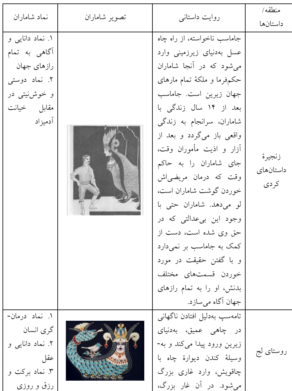
جدول ۱: مقایسه روایت‌های شاماران در مناطق مختلف مکریان (نگارندگان)

تفاوت‌هایی اندک مشاهده می‌شود؛ اما هدف و انگیزه اصلی از خلق و بیان این اسطوره و داستان افسانه‌ای یکی است (جدول شماره ۱).