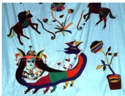
شکل ۱۱: پرده منقوش با تصویر شاماران (روستای لچ، متعلق به سال ۱۳۶۰)

نقش مار در کردستان، بیش از هر چیز دربردارنده مفاهیمی چون نیروهای جهان زیرین، نامیرایی و باروری است و بیش از هر فرهنگ و تمدن دیگری با آیین‌های منطقه خود مرتبط است. هم با نوعی تقدس و احترام همراه است هم با وحشت. رابطه انسان و مار در هیبت شاماران شکل جدیدی به‌خود می‌گیرد که اتفاقاً همچون گذشته خطرناک نیست و از دوستان انسان به‌شمار می‌آید. شاماران نماد دوستی، محافظت پیمان و خوش‌یمنی است (شکل شماره ۱۰).