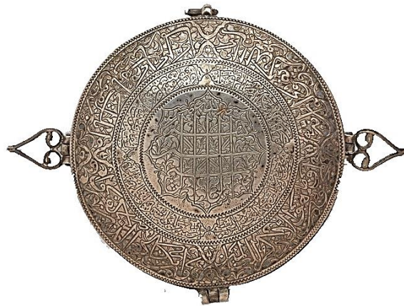
تصویر ۲: بازویند نقره، اواسط قرن ۱۳ هجری ۶/۶ × ۲ cm ( http://jameelcentre.ashmolean.org/collection/6980/9992/0/12 ) (716#details)

دسته بزرگی از بازویندهای طلسمی را غلاف‌های تعویذی تشکیل می‌دهند که حاوی بخش‌هایی از قرآن یا ادعیه هستند. در این آثار هیچ اشاره‌ای به نمادها و جدول‌های طلسمی نمی‌شود. از این رو، اعتقاد غالب در طراحی این آثار، تکیه بر قدرت خداوند و ائمه در رسیدن به ایمنی است؛ زیرا در باور مسلمانان، حفاظت از بیماری، بلا و مصیبت، تنها از طریق توسل به خدا و به خواست او انجام‌پذیر است (تصویر ۲).