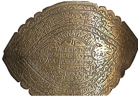
تصویر ۲۲: بازوند شیر و خورشید، قرن ۱۳ هجری برنج https://www.britishmuseum.org/research/collection_online/collection_object_details.aspx?objectId=218042&partId=1&searchText=qajar&images

ج) اعداد: در بسیاری از موارد رمالان و دعانویسان به جای حروف، از معادل عددی آن‌ها استفاده می‌کردند. کاربرد اعداد بر روی بازوندها بسیار گسترده بود (تصویر ۲۲).