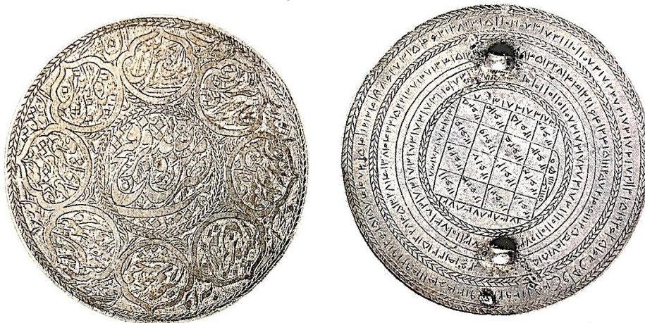
تصویر ۳: دو طرف یک بازویند نقره، قرن ۱۳ هجری (خلیلی، ۱۳۸۷: ۱۱۳)

اگرچه در مبانی فکری مسلمانان استعانت جستن از خداوند متعال، شرطی اساسی برای غلبه بر دشمنان است؛ لیکن در بسیاری از بازوندها ضمن استفاده از آیات قرآنی: «نَصْرٌ مِنَ اللَّهِ وَ فَتْحٌ قَرِيبٌ» (صف/۱۳/۶۱) و «إِنَّا فَتَحْنَا لَكَ فَتْحًا مُبِينًا» (فتح/۱/۴۸) جهت تأثیرگذاری بیشتر، از جدولها و نقوش طلسمی نیز استفاده شده است (تصویر ۳).