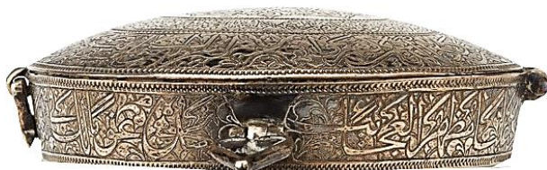
تصویر ۱۸: بازوبند نقره، اواسط قرن ۱۳ هجری http://jameelcentre.ashmolean.org/collection/6980/9992/0/12716#details