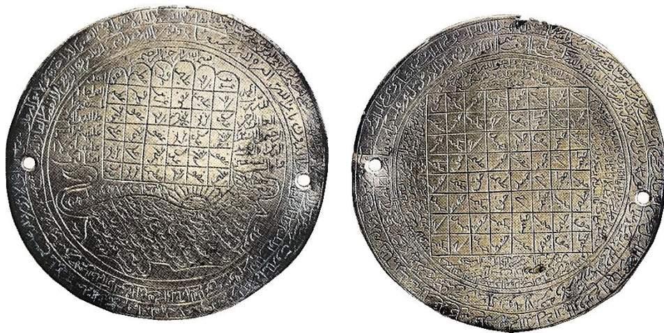
تصویر ۱۵: دو طرف یک بازوبند نقره، اوایل قرن ۱۴ هجری (تناولی، ۱۳۹۴: ۷۵).

الف) اسماء الهی: پیشینیان بر این باور بودند که میان نام، ذات و نیروهای واقعی پیوندی عمیق و استوار برقرار است، به‌گونه‌ای که گویی این دو، یعنی اسم و ذات، مفهوم و بوده‌ای یگانه‌اند و از همین روی با دانستن نام واقعی کسی یا چیزی می‌توان آن را در اختیار گرفت (سرکاراتی، ۱۳۷۷: ۲۲). در نزدیکی به همین مضمون و با استناد به آیه قرآنی «لله اسماء الحسنی فادعوه بها» (اعراف/ ۷/ ۱۷۹) در بسیاری از طلسم‌ها و تعاویذ از اسامی خداوند استفاده شده است (تصویر ۱۵).