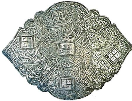
تصویر ۴: بازوبند شیر و الشمس، نقره، قرن ۱۳ هجری 7/6 \times 8/7 cm (تناولی، ۱۳۹۴: ۷۲)