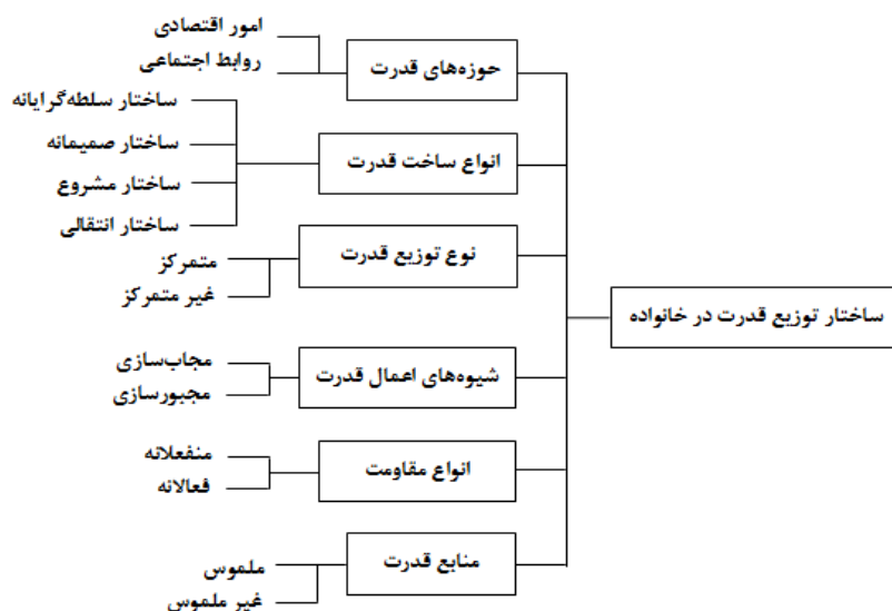
نمودار ۱: ساختار توزیع قدرت در خانواده