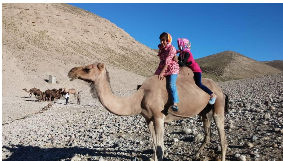
تصویر ۳: شترداری در ایل الیکایی، بیلاق یمین فیروزکوه.

Photo 2: Monument of the camel breeding era, Eyvankey, Garmsar city.