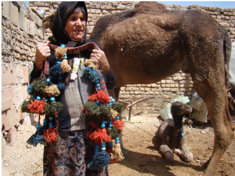
تصویر ۲: یادگار دوران شترداری، ایوانکی شهرستان گرمسار

Photo 2: Monument of the camel breeding era, Eyvankey, Garmsar city.