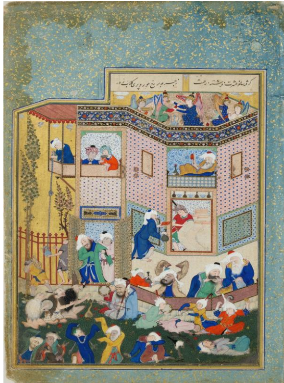
شکل ۱: نقاشی، کار سلطان محمد نقاش، نشان‌دهنده مطربان مجلسی با لباس و صورتک یا بزک بوزینه (پایین، گوشه چپ) (بیضایی، ۱۳۹۶: ۵۹)