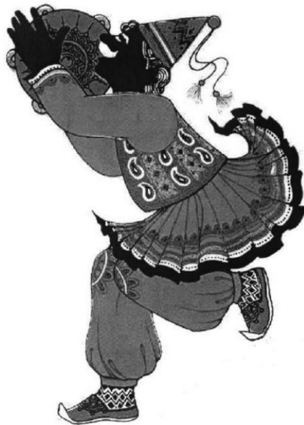
شکل ۲: میر نوروزی (نک: امیدسالار)