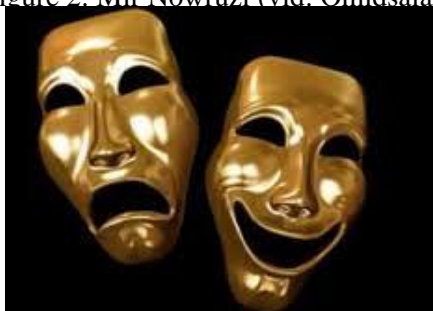
شکل ۳: سیمایچه یا صورتک نمایش