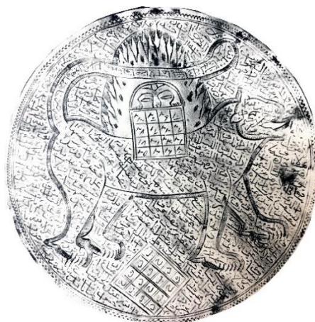
تصویر ۱۲: بازوبند نقره، اوایل قرن ۱۳ هجری ۸/۶ cm. (تناولی، ۱۹۸۵: ۴۰)

ج) شیر و خورشید: در رمزپردازی‌های آیینی و ملی ایران، شیر و خورشید، نه تنها به عنوان یک نماد ملی، بلکه به عنوان یک نماد شیعی، شناخته شده و بر روی آثار مختلف کاربرد گسترده‌ای داشته است. در فرهنگ ایران از دیرباز، خورشید به عنوان مظهر خداوند و شیر نشانه قدرت و اقتدار، هر دو به خدایان مربوط بوده‌اند (یاحقی، ۱۳۷۵: ۲۸۰). در معتقدات شیعی مردم ایران، شیر و خورشید نماد مقدسی است که با شخصیت حضرت علی (ع) و پیامبر اکرم (ص) پیوسته است (خزایی، ۱۳۸۰: ۳۸). در دوره قاجاریه نقش شیر و خورشید کاربردی روزافزون یافت. اهمیت قدسی این نقش و اعتقاد مردم به خوش‌یمنی آن را می‌توان از دلایل این امر برشمرد (تصویر ۱۲).