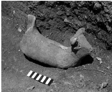
تصویر شماره ۸: تصویر شیر و گاوِ نر در برابر هم بافته شده بر روی لباس آشوربانیپال (استروناخ، ۲۰۰۲).