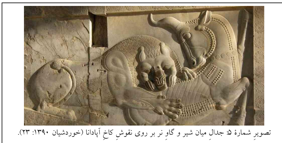
تصویر شماره ۵: جدال میان شیر و گاو بر روی نقوش کاخ آپادانا (خوردشیان ۱۳۹۰: ۲۳).

در حال کشتن گاو (نماد باران) (تصویر شماره ۵) نشان می‌دهد، مشاهده کرد (فلی‌زاده، ۱۳۸۸: ۲۹۰). در نقوش دوره هخامنشی تصویر مبارزه پادشاه با شیر که نماد قدرت پادشاه است نشان داده شده است و در هند الهه دورگا سوار بر شیر با دیو گاو‌میش می‌جنگد که مبارزه خدای نظم علیه دیو بی‌نظمی است و در تخت جمشید نیز شیر در جدال با گاو مشاهده می‌شود که مبارزه خیر و شر و نماد غلبه گرما بر سرما و آغاز بهار است. در هنر هند شیر مرکب الهه دورگا و نماد خوبی به مبارزه با دیو گاو‌میش می‌رود؛ اما در تخت جمشید شیر نماد خورشید و روشنایی مستقیماً با گاو نماد ماه و تاریکی مبارزه می‌کند که به تعبیر دیگر این نبرد نماد آغاز سال نو نیز است (مبینی، ۱۳۸۹: ۴۸). نکته مهم در این نقش برجسته این است که اثری از کشته شدن گاو نیست و به نوعی نقش همچون یک چرخه بر تغییر فصول و برتری یافتن یک نماد بر دیگری دلالت دارد.