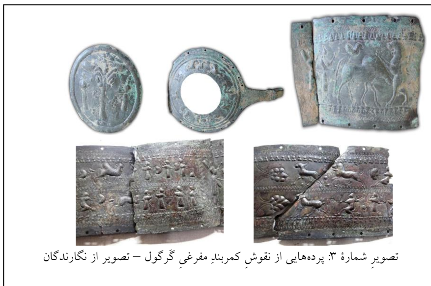
تصویر شماره ۳: پرده‌هایی از نقوش کمر بند مفرغی گرگول

۲. از نظر موضوع نمادین نقوش که می‌توان آن را در ۴ پرده بررسی کرد (تصویر شماره ۳):