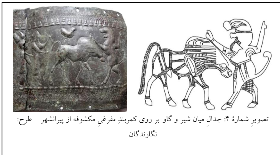
تصویر شماره ۴: جدال میان شیر و گاو بر روی کمر بندِ مفرغیِ مکشوفه از پیرانشهر - طرح:

با توجه به اینکه محل کشف این اثر تاریخی در محدوده جغرافیای تاریخی حکومت مانا واقع شده و معرف سبک هنری مانایی است (مصاحبه با بیننده، ۱۳۹۴؛ ملازاده و بیننده، مقاله در دست چاپ) و نیز همسایگی جغرافیایی مانا با آشور و اورارتو و تأثیر و تأثرات سیاسی و فرهنگی آن‌ها بر همدیگر می‌توان به تأثیر هنر آشور و اورارتو بر روی نقوش این کمر بند قائل بود تا جایی که عناصر متشکله این تصاویر را می‌توان در هنر باستانی و اساطیری این تمدن‌ها ردگیری کرد که موضوع این نوشتار نیست. آنچه موضوع اصلی این مقاله است و نگارندگان را به فکر وجود ارتباط بین داستان فولکلوریک کل و شیر با نقوش این کمر بند متعلق به فرهنگ و هنر مانایی کرده است، آن قسمت از نقوش کمر بند است که مزین به تقابل و کارزار میان شیر و گاو نر است (تصویر شماره ۴).