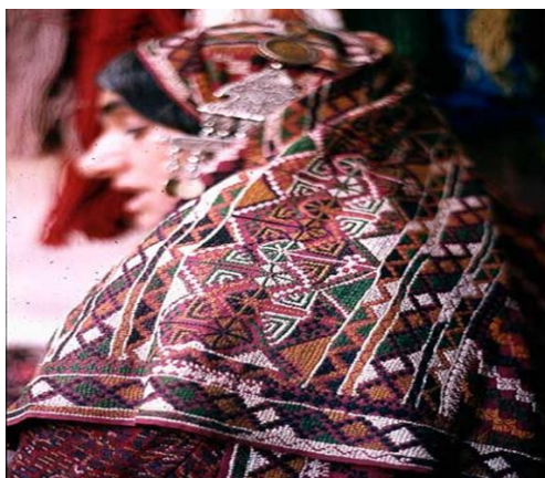
تصویر (۸) - نماد مثلثی زایش در دو طرف سریند

نقش محرّمات عبارت است از تکرار نوارهایی در کنار هم که با حاشیه‌هایی باریک از هم جدا و مشخص می‌شوند (حصوری، ۱۳۸۸: ۵۱). مهرماتک می‌تواند اشکال و رنگ‌های متنوعی داشته باشد و به صورت نوارهای عمودی، افقی یا مورب طراحی شود. کهن‌ترین اثر به‌دست‌آمده از این نماد به اواخر هزاره سوم پیش از میلاد مربوط می‌شود و در کتیبه‌های مصری به وجود چنین طرح‌هایی بر روی لباس ایرانیان اشاره شده است (همان، ۱۳۸۸: ۴۷). این طرح همچنین بر روی ظروف یونانی هم‌عصر با هخامنشیان - که لباس ایرانیان را در آن دوره نشان می‌دهد - و بر روی آثار سفالینه طبرستان مربوط به سده‌های ۴ - ۵ هجری نیز وجود داشته است. در حال حاضر می‌توان آن را بر روی فرش‌هایی که در مناطق مختلف ایران بافته می‌شوند، از جمله کردستان، بلوچ، قم، تبریز و فارس (قشقایی) مشاهده کرد.