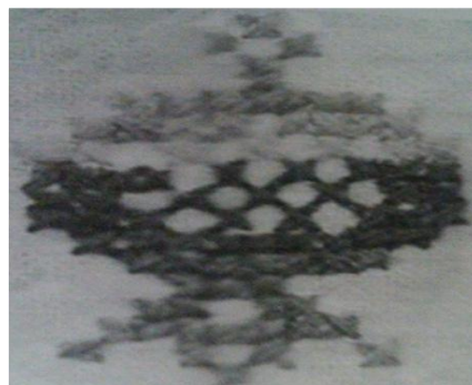
تصویر (۱) - نقش انار در آثار سوزن‌دوزی سنگسری تصویر (۲) - نقش خروس در آثار سوزن‌دوزی سنگسری