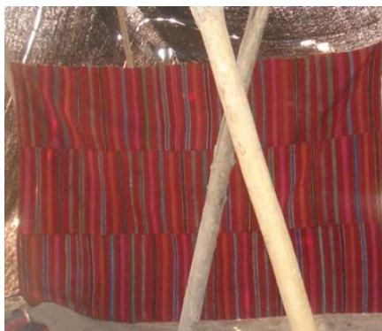
تصویر (۹) - نقش محرمات بر پارچه ابریشمی

خودنمایی کنند. امروزه زنان هنرمند ایل سنگسری نقش هلال ماه و ستاره را بر روی زیورآلات خود از جمله موبند و گردن‌بند نقره‌ای حک می‌کنند (نک: تصویر ۱۱). در زمان ساسانیان معابد و آتشکده‌های فراوان در نقاط مختلف ایران برای پرستش ایزدبانوی آب‌ها بر روی چشمه‌های آب ساخته شدند که بازمانده یکی از آنها در منطقه راه‌بند مهدیشهر قرار دارد. در باور ایرانیان باستان آب این چشمه‌ها مقدس و آوردن آب از آنها خوش‌یمن بود. در حال حاضر نیز این مردم بخشی از مناسک دینی خود را در اطراف بقایای معبد اناهیتا و چشمه راه‌بند یا سرچشمه زیارت اجرا می‌کنند و به برگزاری مراسم دعا و گستردن سفره حضرت فاطمه (س) می‌پردازند (معرفی جاذبه‌های تاریخی...، ۱۳۹۴: ۷).