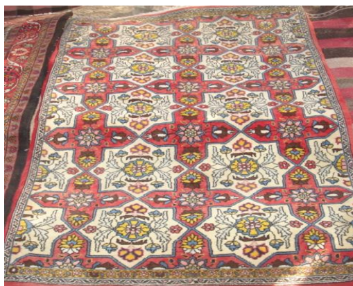
تصویر (۵) - نقش جام مهر در هنر سوزن‌دوزی

نماد کهن دیگری که در آثار بافته و سوزن‌دوزی مردم سنگسر وجود دارد و قدمتش به پیش از آیین مزدایی می‌رسد، نماد باروری است که در قالب نقوش مثلث به‌عنوان نمادی از مادینگی و اهمیت نقش مادر در تولید نسل خودنمایی می‌کند. شاید یکی از دغدغه‌های مهم جوامع کهن مادرتبار و همچنین برخی از جوامع سنتی در حال حاضر، ازدیاد نسل با هدف امرار معاش و ادامه زندگی بوده است و حس درونی نیاز به تناسل، به شکل این نماد، تجسم یافته است (همان، ۴۱). این نقش در آثار سنگسری در حواشی و گاه در متن دست‌بافته‌ها دیده می‌شود (نک: تصویر ۸).