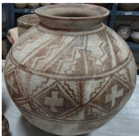
تصویر (۷) - نماد صلیب، جام سفالی، شهر سوخته، هزاره ۳ ق.م.

نقش دیگر مَهْرَمَت یا محرّمات است (تصویر ۹) که قدمت آن به زمانی می‌رسد که دعاها را به صورت شکل نگار بر روی نوارهای چرمی می‌نوشتند و به بازو می‌بستند یا به گردن می‌آویختند. چنین رسمی تا دوره اسلامی و سده‌های اخیر، حتی تا امروز در میان ایرانیان البته با اشکالی تعدیل‌یافته و مثلاً به صورت نوشتن دعا بر روی لباس و آویختن دعا به منظور جلوگیری از چشم‌زخم کمابیش ادامه یافته است.