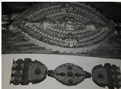
تصویر (۳) - نقش هراتی سوزن‌دوزی شده بر روی بازوبند سنگسری