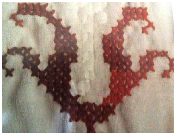
تصویر (۶) - نقش صلیب در فرش دست‌بافت سنگسری

نقش دیگر مَهْرَمَت یا محرّمات است (تصویر ۹) که قدمت آن به زمانی می‌رسد که دعاها را به صورت شکل نگار بر روی نوارهای چرمی می‌نوشتند و به بازو می‌بستند یا به گردن می‌آویختند. چنین رسمی تا دوره اسلامی و سده‌های اخیر، حتی تا امروز در میان ایرانیان البته با اشکالی تعدیل‌یافته و مثلاً به صورت نوشتن دعا بر روی لباس و آویختن دعا به منظور جلوگیری از چشم‌زخم کمابیش ادامه یافته است.