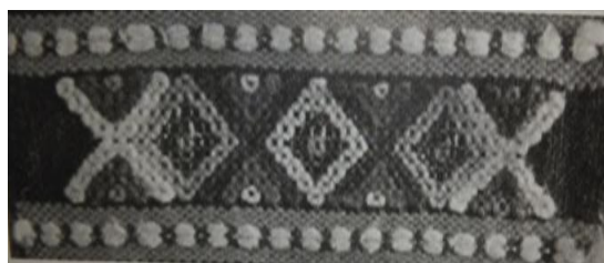
تصویر (۴) - نقش دو ماهی در طرفین همراه با گل شش‌پر

این طرح بر روی فرش‌ها و قالیچه‌های بافته شده در استان‌های مختلف ایران از جمله در مناطق بلوچ، بیرجند، همدان، ملایر، قشقایی، بیجار و تبریز هم دیده می‌شود (همان، ۶)؛ بنابراین علاوه بر ایل سنگسری در آثار دست‌بافت عشایر بلوچ، کرد، لر، ترک و فارس نیز وجود دارد. ایزد مهر علاوه بر آثار دستی و هنری در باورها و مناسک آیینی مردم سنگسری نیز جایگاه خاصی دارد. پرستشگاه یا معبد مهر در مهدیشهر بر فراز کوهی به نام مهرباب یا امیر در کنار قلعه‌ای باستانی قرار دارد که پس از اسلام نیز همچنان تقدس خود را حفظ کرده است. امروزه این مردم بیشتر هنگام طلوع خورشید مناسک آیین جدید را همراه با انجام مراسم عبادی، برافروختن شمع و خواندن دعا در این معبد به جا می‌آورند (معرفی جاذبه‌های تاریخی ... ، ۱۳۹۴: ۶).