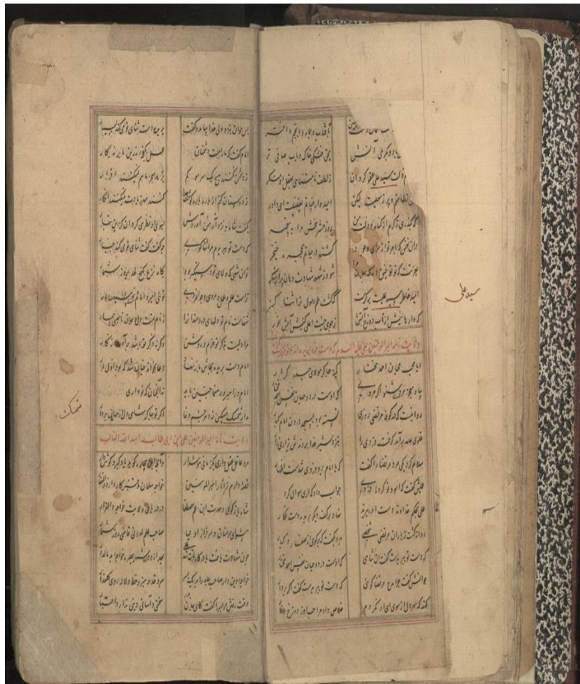
تصویر ۱: «ولایت‌نامه» در جنگ ۳۵۲۸ دانشگاه تهران

بخش مقدمه، تنه اصلی قصیده و شریطه زبان شعر ساده و نرم است. ذکر داستان یکی از عناصر اصلی این نوع ادبی است که در تنه اصلی قصیده جای دارد و شاخصه اصلی این داستان آن است که در ذکر کرامات و معجزات حضرت علی (ع) است. این گونه ادبی به فرهنگ شیعیان اختصاص دارد و بیشتر در شأن حضرت علی (ع) سروده شده است.