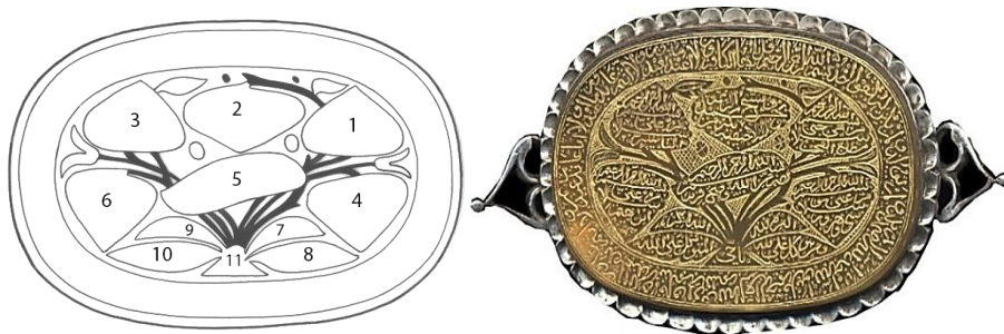
تصویر ۱۴: بازوبند عقیق، دوره قاجار، همراه با جزئیات

و) نباتی: درخت‌های مقدس همراه با اساطیر و آیین‌های مربوط به آن بخش مهمی از مذهب، تاریخ، باورهای قومی و روایت‌های مردمی رایج در سرتاسر جهان را تشکیل می‌دهند. درخت جاودانگی، هوم سپید، درخت هزار تخمه، درخت گوگرد (همان، ۶۵، ۸۷)، درخت معرفت (بقره/ ۳۵/۲)، درخت مریم یا نخل (مریم/ ۱۹/ ۲۳)، و شجر اخضر (یس/ ۳۶/ ۸۰)، نمونه‌هایی از معروف‌ترین درختان مقدس شناخته‌شده در فرهنگ ایرانی - اسلامی پیش و پس از اسلام هستند. نقوش گیاهی در بازوبندها خیلی مورد استفاده نبوده است و در مواردی معدود، به شکل نوعی درخت یا گیاه ریواس و نظایر آن مشاهده می‌شود (تصویر ۱۴).