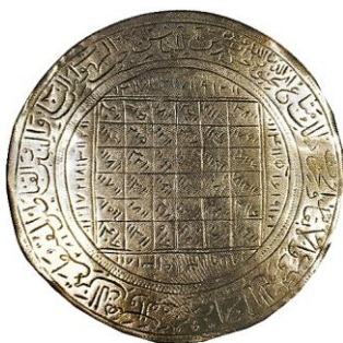
تصویر ۲۳: بازوند نقره، قرن ۱۴ هجری، cm ۶/۷ (تناولی، ۱۳۹۴: ۷۴)

د) مربعات جادویی: در این نوع طلسم که بیشتر بر جدول و عدد استوار است، از مجموع چند عدد، به جدول‌هایی می‌رسیدند که به مربعات جادویی مشهور است (عزیزی فر، ۱۳۹۲: ۹۰). اعداد مفروض را از حروف سوره‌های قرآن می‌گرفتند و آن‌ها را در جدول‌های مختلف قرار می‌دادند و برای رسیدن به اهداف و خواسته‌های متفاوت به کار می‌بردند (تصویر ۲۳).