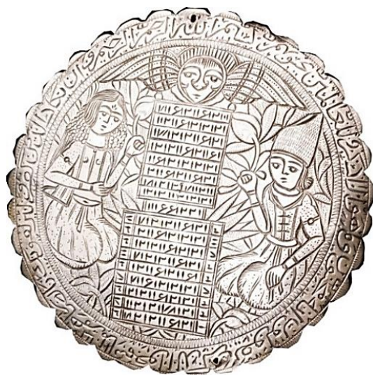
تصویر ۸: بازوبند نقره، قرن ۱۳ هجری cm )۷/۵

http://www.qajarwomen.org/fa/ite (ms/1333A14.html