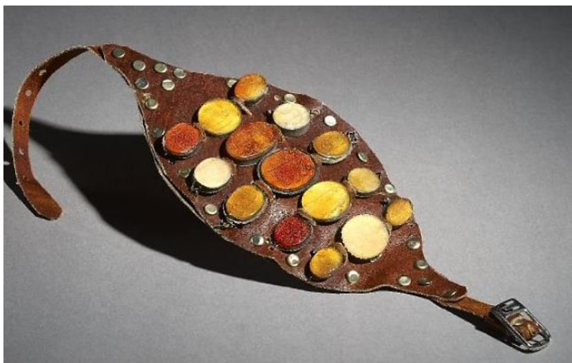
تصویر ۱: بازوبند پهلوانی، قرن ۱۳ هجری

بازوبندهای مهره‌ای تا دوره قاجار در ایران رایج بود. رسم بستن بازوبند پهلوانی نیز در این دوره ادامه داشت. بازو مهره یا بازوبند پهلوانی در دوره ناصری از جانب شاه به پهلوان پایتخت - که پشت دیگر یلان را به خاک رسانده بود - اعطا می‌شد و تا زمانی که دیگری بر او تفوق نمی‌یافت امتیاز مزبور از آن وی بود (شاملو، ۱۳۷۷: ۱۱۵۵). تصویر ۱ نمونه‌ای از این بازوبندهاست.