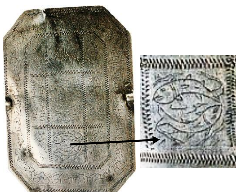
تصویر ۷: بازوند طلسمی، نقره، قاجار (خلیلی، ۱۳۸۷: ۱۱۲).

توسل به نمادهای سحرآمیز از قدیم‌ترین روش‌های درمانی در سراسر جهان است. بر این بازوندها اکثراً جدول‌هایی نقاشی شده است. در خانه‌ای از جدول، یک جفت شمایل انسانی زن و مرد و در خانه‌ای دیگر نقش جفت ماهی، یا نمادهای خورشید و ماه به‌عنوان نماد باروری و نیک‌فرجامی حکاکی شده‌اند (تصویر ۷).