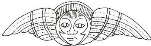
تصویر ۱۱: خورشید بالدار، برگرفته از بازوبند شماره ۸.

بازوبندهایی با موضوع عشق و ازدواج، حکاکی شده است و احتمالاً برای آن کاربردی جادویی به عنوان نمادی از خورشید گرمابخش و عشق قائل بوده‌اند (تصاویر ۶ و ۸).