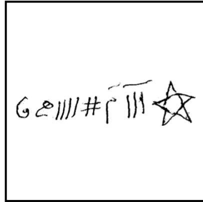
تصویر ۲۰: بازوبند نقره، قرن ۱۳ هجری (خلیلی، ۱۳۸۷: ۱۱۳)