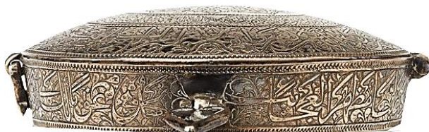
تصویر ۱۸: بازوبند نقره، اواسط قرن ۱۳ هجری http://jameelcentre.ashmolean.org/collection/6980/9992/0/12716#details