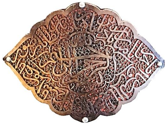
تصویر ۹: بازوبند به شکل چشم، نقره، اوایل قرن ۱۳ هجری ۷/۴ × ۹/۷ cm (تناولی، ۱۳۹۴: ۷۳)

ب) چشم: تمثیلات و عباراتی همچون چشم سر، چشم دل، چشم حق و نظایر آن، بیانگر کاربرد نمادین چشم در فرهنگ ایرانی - اسلامی است که در آن چشم به‌عنوان نماد بصیرت باطنی استفاده می‌شود. کلمه عین در سنت اسلام، علاوه بر چشم به معنی تمامیتی خاص، چشمه یا جوهر نیز هست و به‌عنوان نماد شناخت و بینش مافوق طبیعت به کار می‌رود. تک‌چشم بدون پلک، نماد جوهر و آگاهی الهی است (شوالیه و گربران، ۱۳۸۴: ۵۱۴) (تصویر ۹).