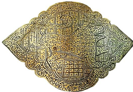
تصویر ۱۰: بازوبند با نقش شیر، نقره، قرن ۱۳ هجری (تناول، ۱۳۹۴: ۷۲)

الف) شیر: شیر مظهر قدرت، توان و نیرو بوده است و در روزگار باستان، به-منزله مظهر و نماینده خورشید شناخته می‌شد. این نقش از پرتکرارترین نقوش در هنر ایران پیش و پس از اسلام است. نقش شیر به‌تنهایی و یا همراه با خورشید، پس از اسلام دارای معانی مذهبی است. در بسیاری از این آثار نقش شیر، نماد حضرت علی (ع) بوده و شاخص‌ترین نماد شیعی به‌کار رفته در آثار مختلف هنر شیعی است (خزایی، ۱۳۸۰: ۳۸) (تصویر ۱۰)