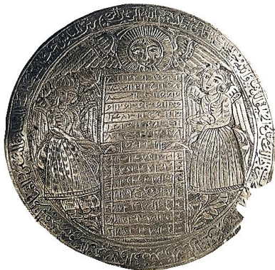
تصویر ۶: بازوبند طلسمی، نقره، قاجار، ۷/۱ cm (تناولی، ۱۳۹۴: ۷۴)

رسیدن به سعادت، عاقبت به خیری و به دست آوردن نعمت‌ها و لذت‌های دنیوی از دیگر مواردی است که بر بازوبندها نقش شده است. برای این منظور اغلب آیه ۱۴ سوره آل عمران که در آن به امور مادی و تعلقاتی همچون زنان، فرزندان، اموال هنگفت، اسب‌های ممتاز، چهارپایان و زراعت اشاره شده است، استفاده می‌شد (تصویر ۵).