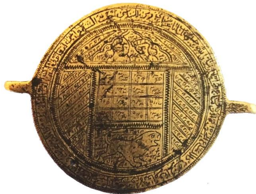
تصویر ۵: بازوبند طلسم و دعا، برنج، اوایل قرن ۱۳ ه، ۴/۸ cm، مأخذ: (تناولی، ۱۳۹۴: ۷۵)