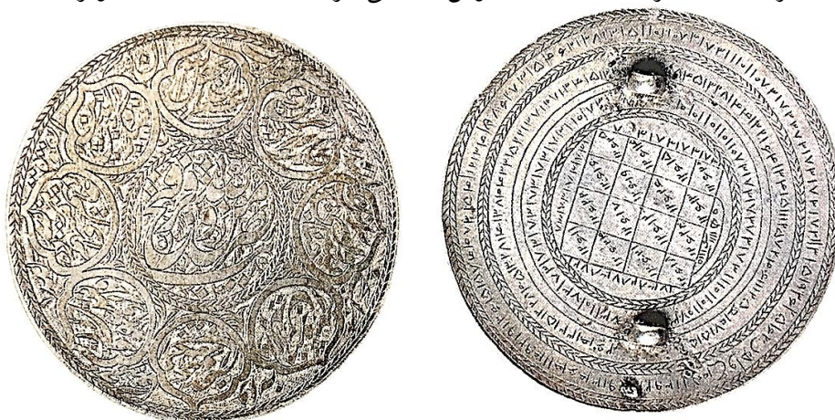
تصویر ۳: دو طرف یک بازویند نقره، قرن ۱۳ هجری (خلیلی، ۱۳۸۷: ۱۱۳)

اگرچه در مبانی فکری مسلمانان استعانت جستن از خداوند متعال، شرطی اساسی برای غلبه بر دشمنان است؛ لیکن در بسیاری از بازوندها ضمن استفاده از آیات قرآنی: «نَصْرٌ مِنَ اللَّهِ وَ فَتْحٌ قَرِيبٌ» (صف/۱۳/۶۱) و «إِنَّا فَتَحْنَا لَكَ فَتْحًا مُبِينًا» (فتح/۱/۴۸) جهت تأثیرگذاری بیشتر، از جدولها و نقوش طلسمی نیز استفاده شده است (تصویر ۳).