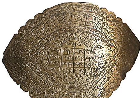
تصویر ۲۲: بازوند شیر و خورشید، قرن ۱۳ هجری برنج

ج) اعداد: در بسیاری از موارد رمالان و دعانویسان به جای حروف، از معادل عددی آن‌ها استفاده می‌کردند. کاربرد اعداد بر روی بازوندها بسیار گسترده بود (تصویر ۲۲).