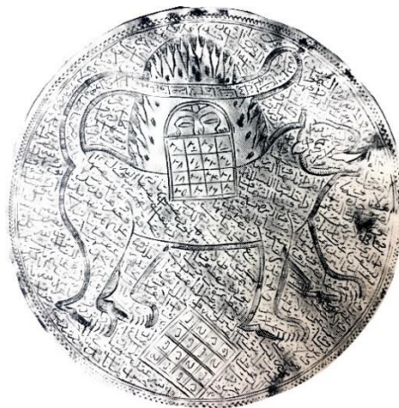
تصویر ۱۲: بازوبند نقره، اوایل قرن ۱۳ هجری ۸/۶ cm. (تناولی، ۱۹۸۵: ۴۰)

ج) شیر و خورشید: در رمزپردازی‌های آیینی و ملی ایران، شیر و خورشید، نه تنها به عنوان یک نماد ملی، بلکه به عنوان یک نماد شیعی، شناخته شده و بر روی آثار مختلف کاربرد گسترده‌ای داشته است. در فرهنگ ایران از دیرباز، خورشید به عنوان مظهر خداوند و شیر نشانه قدرت و اقتدار، هر دو به خدایان مربوط بوده‌اند (یاحقی، ۱۳۷۵: ۲۸۰). در معتقدات شیعی مردم ایران، شیر و خورشید نماد مقدسی است که با شخصیت حضرت علی (ع) و پیامبر اکرم (ص) پیوسته است (خزایی، ۱۳۸۰: ۳۸). در دوره قاجاریه نقش شیر و خورشید کاربردی روزافزون یافت. اهمیت قدسی این نقش و اعتقاد مردم به خوش‌یمنی آن را می‌توان از دلایل این امر برشمرد (تصویر ۱۲).